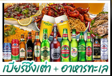
เบียร์ซิงคโปร์ + อาหารทะเล