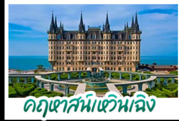
คุกาส์หวิมเจิง

เมืองเก่าซิงคโปร์ - คุกาส์หวิมเจิง เบียร์ซิงคโปร์ + อาหารทะเล สตรีทอาร์ต สตูดิโอจิบลิ