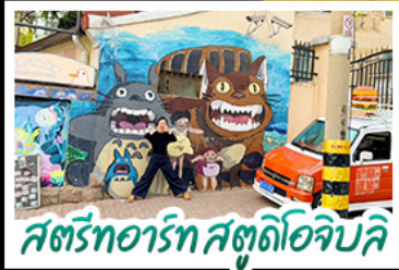
สตรีทอาร์ต สตูดิโอจิบลิ