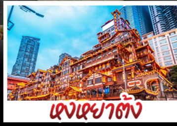
แฉงแฉยาตั้ง