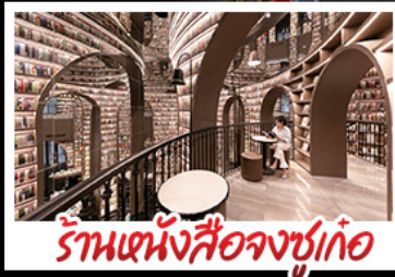
ร้านหนังสือจชชู่เก้อ