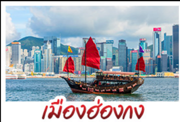
เมืองฮ่องกง

เมืองเก่าชิงเต่า - วิวเมืองฮ่องกง โรงเบียร์ชิงเต่า - ท่าเรือชาวประมงเยียนไถ