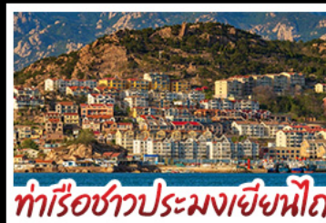
ท่าเรือชาวประมงเยียนไถ