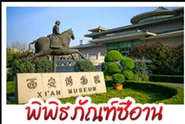
พิพิธภัณฑ์ซีอาน