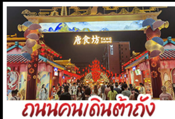
ถนนคนเดินต้าถิง