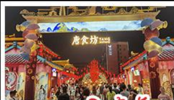
ถนนคนเดินต้าถิง