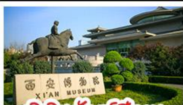
พิพิธภัณฑ์ซีอาน