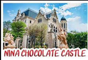
NINA CHOCOLATE CASTLE

ทะเลสาบสุริยจันทราร - ไทเป 101 จิวเฟิน - NINA CHOCOLATE CASTLE MONSTER VILLAGE - ซีเหมินติง แมมูพิศข ปลาประรานาธิบดี เขี้ยวหลงเปา / ซาบูไต้หวั่น