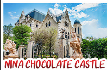
NINA CHOCOLATE CASTLE

ทะเลสาบสุริยันจันทรา - ไทเป 101 จิวเฟิ่น - NINA CHOCOLATE CASTLE MONSTER VILLAGE - ชิเหมินต้ง เมนูพิเศษ ปลาประจานาธิบดี เซี่ยวหลงเปา / ซาบูใต้หวัน