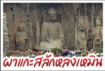
ผาแกะสลักหลงเหมิน

เที่ยวครบ 4 มรดกโลก ถ้ำหลงเหมิน - สุสานฉินซีฮ่องเต้ - วัดเส้าหลิน หมู่บ้านไต้คินसानโจว - หมู่บ้านกัวเลียงซุน