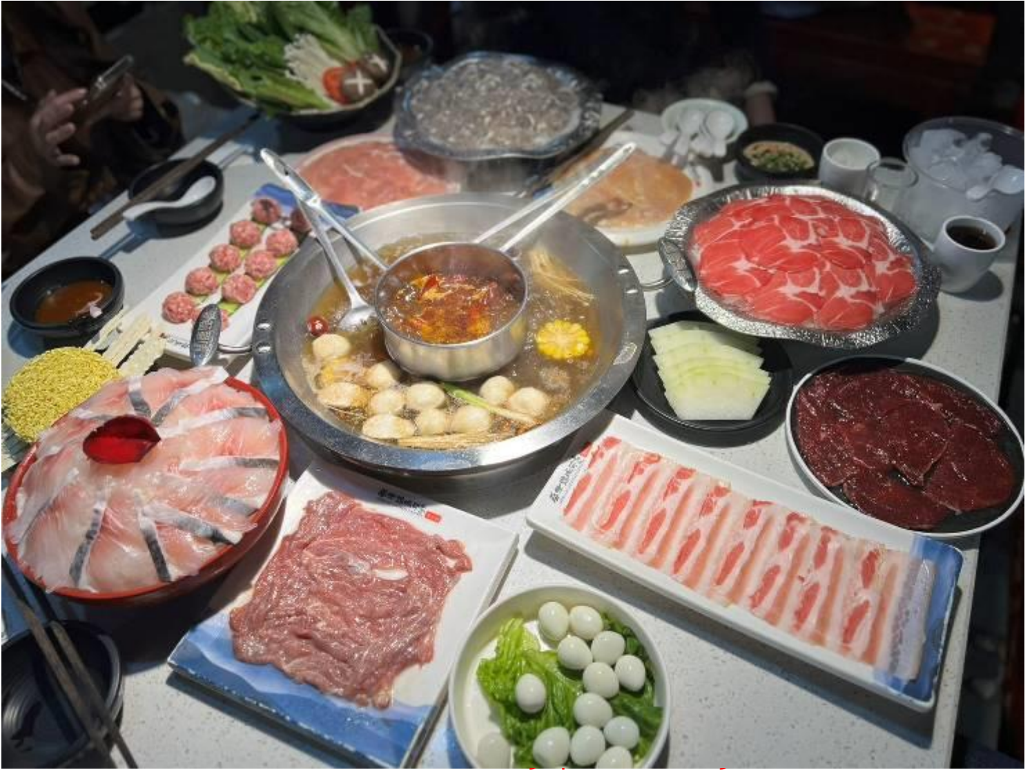
กลางวัน รับประทานอาหารกลางวัน ณ ภัตตาคาร (มื่อที่ 8) *เมนูพิเศษ สุกี้หมาล่าเสฉวน