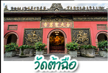
วัดต้าจื่อ