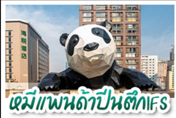
หมีแพนด้าปิ่นตึกIFS

อุทยานภูเขาสี่ดรุณี - อุทยานปักกิ่งโกว สะพานโบราณหนานเจียว - วัดต้าจื่อ หมีแพนด้าปิ่นตึกIFS - พัก 4 ดาว ช้อปปิ้งจอยักษ์ถนนไท่กู่หลี่ + ถนนชุนชี่อู๋ เมนูพิเศษ สุกี้หมาล่าเสววน