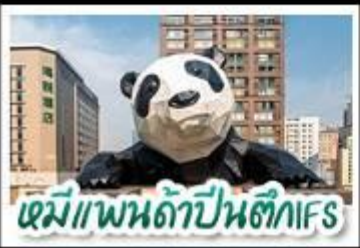
หมีแพนด้าป็นตึกIFS