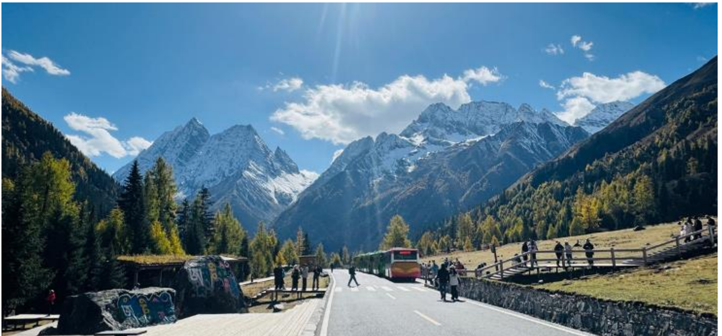
2UTFU-VZ001 เฉิงตู ภูเขาสี่ตรุณี อุทยานπί้งเฉียวโกว โดยสายการบิน Thai VietJet Air (VZ)

รับประทานอาหารเช้า ณ ห้องอาหารภายในโรงแรม (มื้อที่ 1)