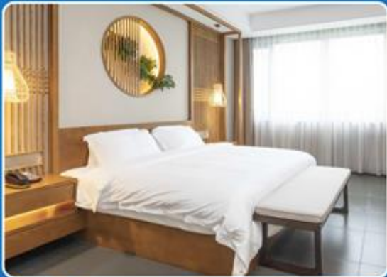
👤👤 DOUBLE (DBL)