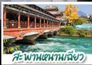
สะพานเจหนานเฉียว