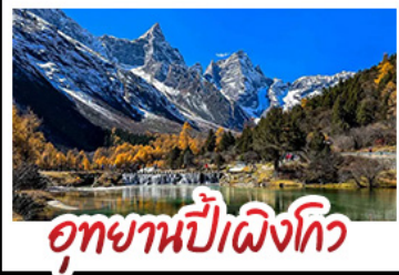
อุทยานป่าเผิงโกว

อุทยานสี่ฤดู - อุทยานป่าเผิงโกว - อุทยานจิวจ้ายโกว รถไฟความเร็วสูง - EASTERN SUBURB MEMORY ถนนโบราณความจำย - วัดต้าฉือ ช้อปปิ้งย่านคิง ถนนไท่กู่หฺสึ + ถนนซุนซีลู่