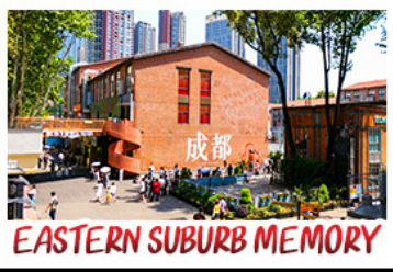
EASTERN SUBURB MEMORY