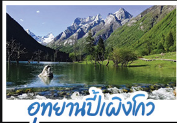
อุทยานปี้เผิงโกว