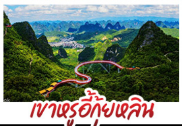
เฝาทู้อี้ทุยหลิน