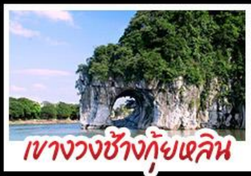
เขาวงกตช้างกุ้ยหลิน

สองเรือแม่น้ำลี่เจียง สวนสตรอว์เบอร์รี่ ทัศนียภาพคดโค้ง นั่งบอลูนชมวิว 360 องศา ทางวงช้างกุ้ยหลิน ทำฟู้้อ พาทู้อี้ เมืองกุ้ยหลิน รถไฟความเร็วสูง พักโรงแรมระดับ 5 ดาว เมบูอาหารพิเศษ POP MART