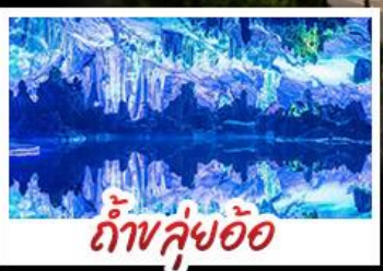
ถ้ำหลู่ฮ้อ