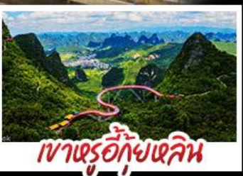
เขาตรู้อีกุ้ยหลิน