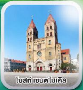
โบสถ์ เซนต์ไมเคิล