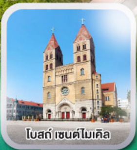
โบสถ์ เซนต์ไมเคิล