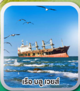
เรือ บลูเวสต์