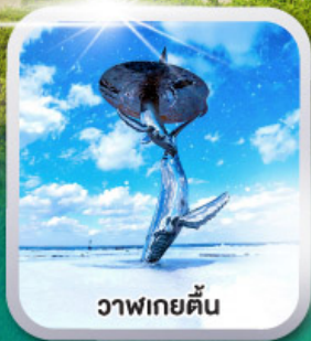
วาฬเกยตื้น