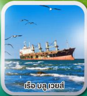
เรือบลูเวย์ส