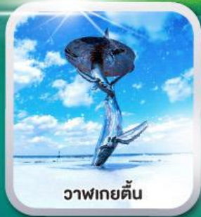
วาฬยกตัว