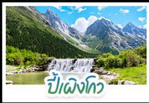
ปี่ผิงโกว