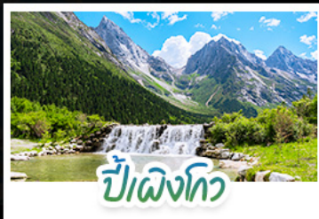
ปีติงโกว