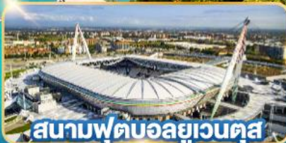
สนามฟุตบอลยูเวนตุส