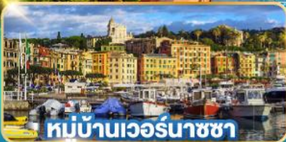
หมู่บ้านเวอร์นาซซา