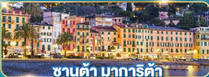
ซานต้า มารีต้า