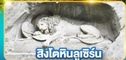
สิงโตหินลูซิิร์น