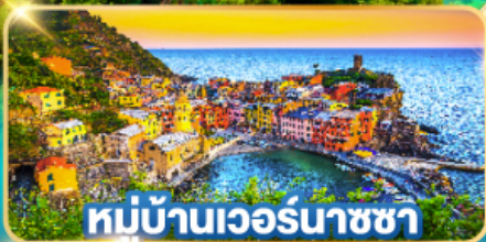
หมู่บ้านเวอร์นาซซา