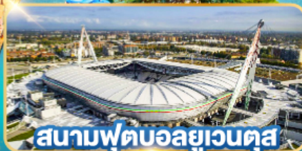
สนามฟุตบอลยูเวนตุส