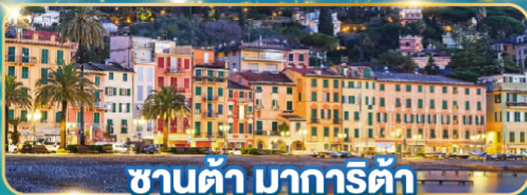
ซานต้า มาร์กัริต้า

พิเศษ! ขึ้นกระเช้า 360 องศา พิชิตยอดเวทีกิตติส