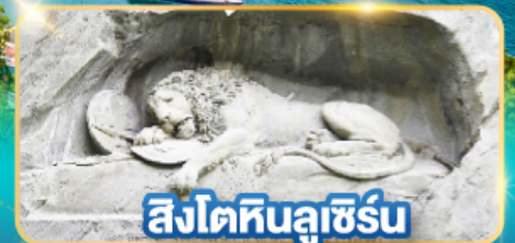
สิงโตหินลูเซิร์น