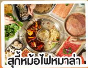
สุกี้หม้อไฟหมอลำ