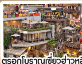
ตรอกโบราณเขี้ยวอาวหลี่