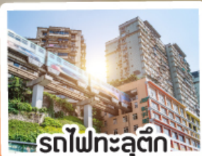
รถไฟฟ้าทะลุติ๊ก