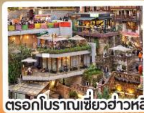
ตอรอกโบราณเขี้ยวอ่าวหลี่