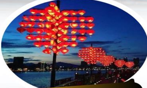
สะพานแห่งความรัก