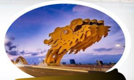
สะพานมังกร (Dragon Bridge)

นำท่านชม สวน APEC มุมถ่ายรูปสุดชิคที่ไม่ควรพลาดในดานัง ตั้งอยู่ริมฝั่งแม่น้ำฮาน ใกล้ๆ สะพานมังกร เมืองดานังนั่นเอง ซึ่งประเทศเวียดนามสร้างไว้เพื่อต้อนรับการประชุม APEC ที่ประเทศเวียดนามในปี 2017 โดยมีจุดเด่นคือเป็นโดมขนาดยักษ์ ที่สร้างมาจากเหล็ก 200 ตัน รูปทรงมีลักษณะเหมือน 'วาวยักษ์' ซึ่งใหญ่จริง และทาสีขาวได้อย่างลงตัว ถ่ายรูปออกมาสวยชิคทุกมุม