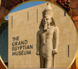
พิพิธภัณฑ์แกรนด์อียิปต์