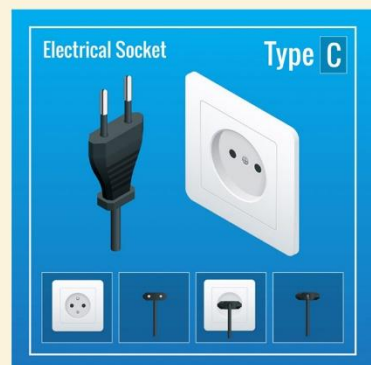
ปลั๊กไฟที่ใช้ที่อียิปต์