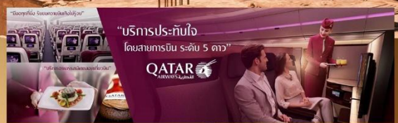
"บริการประทับใจ โดยสายการบิน ระดับ 5 ดาว"