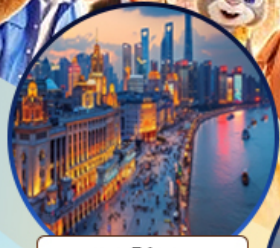
หาดไต้หวัน

สนุกจุใจ เชียงไฮ้ ดิสนีย์แลนด์ ฟรีเดย์ 1 วัน