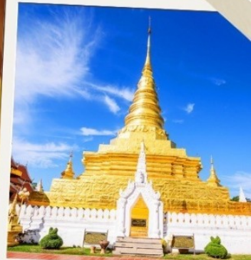
วัดพระธาตุแช่แห้ง

2 ท่านขึ้นไป 14,499 บาท/ท่าน 4 ท่านขึ้นไป 12,799 บาท/ท่าน 6 ท่านขึ้นไป 10,999 บาท/ท่าน