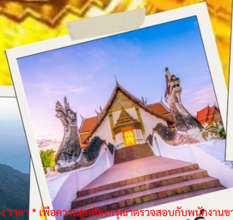
วัดถ้ำกม