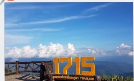
จุดชมวิวที่มีความสูง 1715