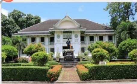
คู่มือเจ้าหลวงเมืองแพร์