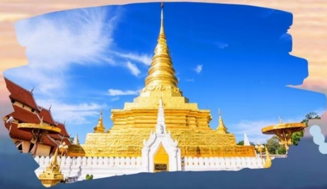
วัดพระธาตุแช่แห้ง