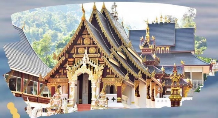
วัดท่าเซตวัน