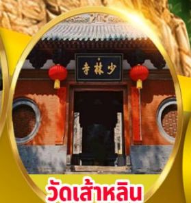
วัดเล่าหลิน