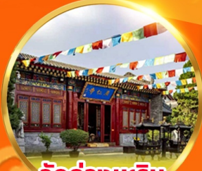
วัดกวางเหริน