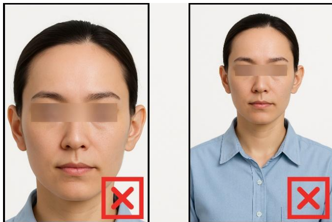
รูปที่ไม่ได้ขนาด ตามที่สถานทูตกำหนด