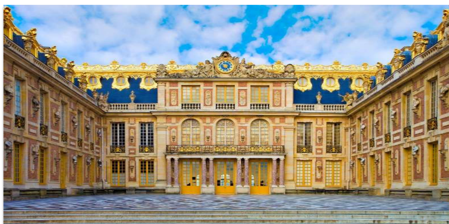
CHÂTEAU DE VERSAILLES

จากนั้นนำท่าน เข้าชมความงามของ “พระราชวังแวร์ซายส์” (Palace of Versailles) หนึ่งในสถานที่สำคัญทางประวัติศาสตร์และวัฒนธรรมของประเทศฝรั่งเศส ซึ่งได้รับการขึ้นทะเบียนเป็น มรดกโลกโดยองค์การยูเนสโก และได้รับการยกย่องให้เป็น หนึ่งในเจ็ดสิ่งมหัศจรรย์ของโลกยุคใหม่ ด้วยความยิ่งใหญ่