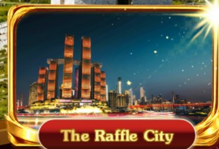
The Raffle City