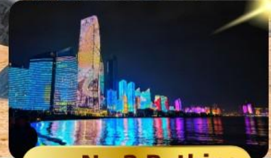
หาด No.3 Bathing

เมนูพิเศษ ซาบูสายพาน 6 วัน 4 คืน เดินทาง : พฤษภาคม 69