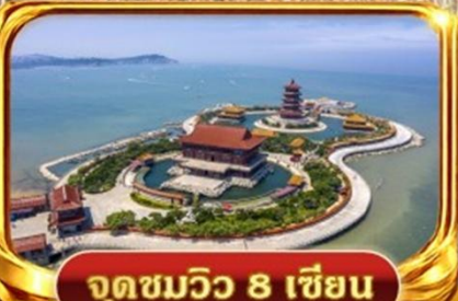
จุดชมวิว 8 เซียน