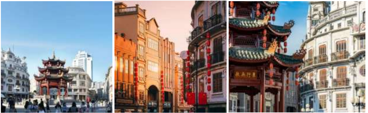
โรงแรมที่พัก โรงแรมเวียนนา เฉาหยาง ไฮ-สปีด เทรน สเตชั่น (Vienna Hotel Chaoyang High-Speed Train Station) หรือเทียบเท่าระดับ 4 ดาว