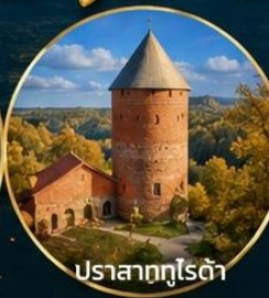
ปราสาทกุโรต้า