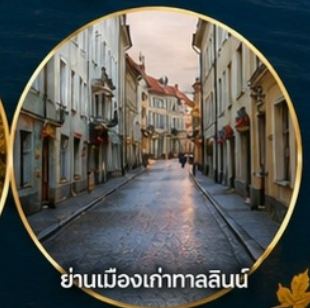
ย่านเมืองเก่าทาลลินน์