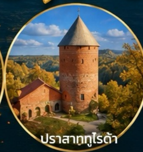
ปราสาทกูโรต้า