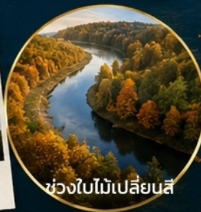
ช่วงใบไม้เปลี่ยนสี