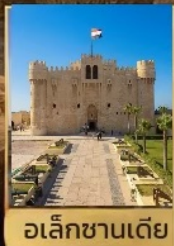
อเล็กซานเดีย