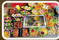
ปิ้งย่าง BBQ