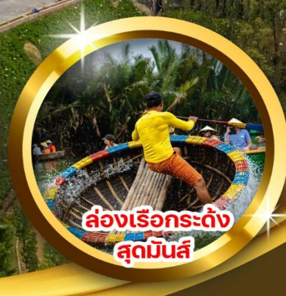
ล่องเรือกระดัง ลุดมินส์