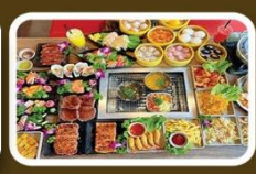
“บั้งหมี” บั้งย่าง BBQ