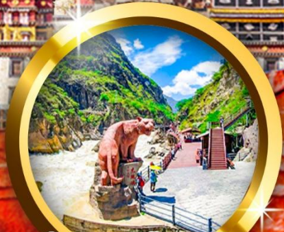
ช่องแคบเสีอกระโจน