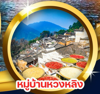
หมู่บ้านหองหลัง