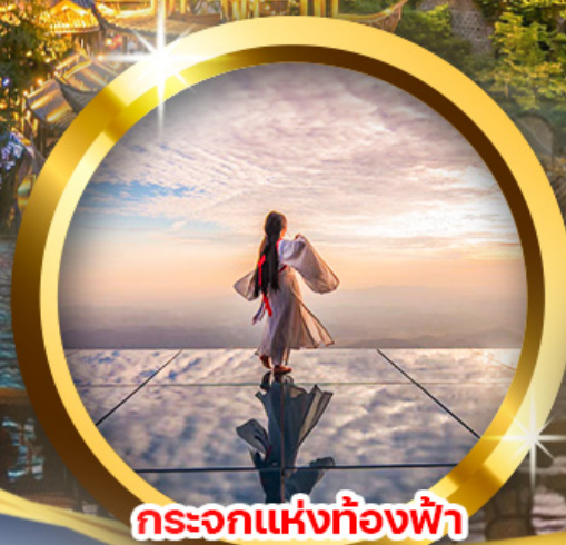
กระบอกแห่งท้องฟ้า