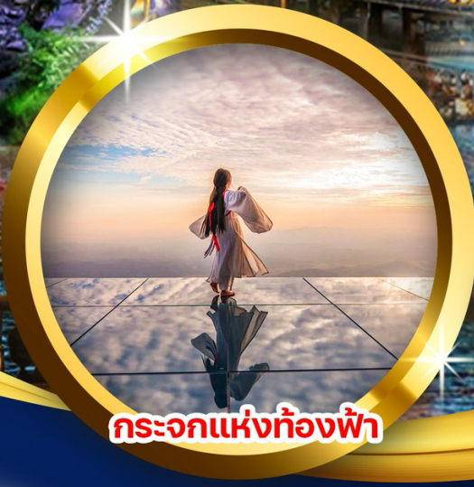
กระบอกแห่งท้องฟ้า