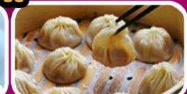
ไก่ขอกาน+หมูตุ๋นพะ+เสี่ยวหลงเปา