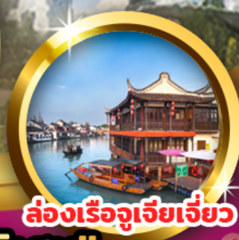
ล่องเรือจูเจียเจียว