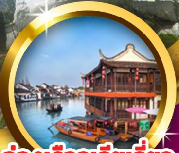
ล่องเรือจูเจียเจียว