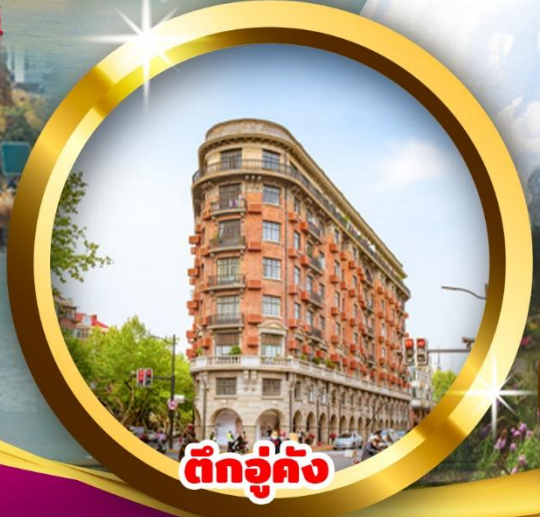
ตึกอู่ต้ง