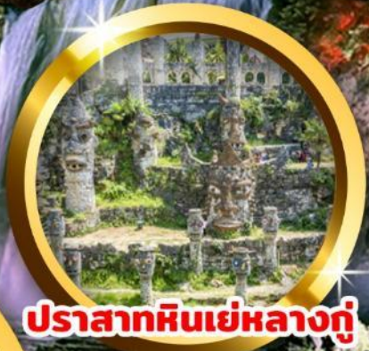
ปราสาทหินเย่หลางกุ๋