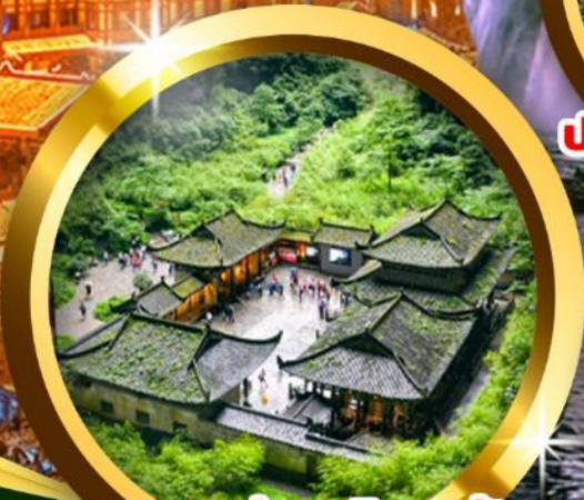
อุทยานแห่งชาติหลุมฟ้า