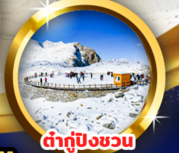
ต่ากู่ปิงชอน