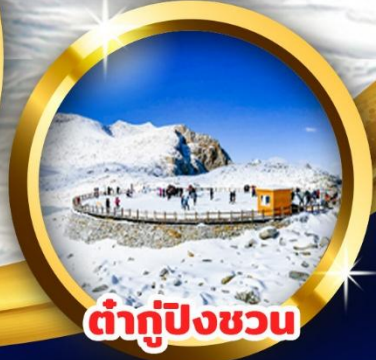
ต่ากู่ปิงชว่น