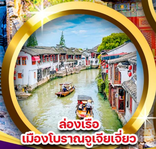
ล่องเรือ เมืองโบราณจูเจียเจี้ยว