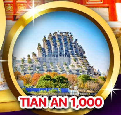
TIAN AN 1,000