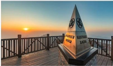
ฟานซิปัน