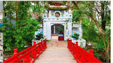
วัดห่งอกเซิน

*ทางบริษัทฯ ขอสงวนสิทธิ์ในการสลับโปรแกรมทัวร์ตามความเหมาะสมขึ้นอยู่กับสถานการณ์หน้างาน โดยคำนึงถึงผลประโยชน์ของลูกค้าเป็นสำคัญ