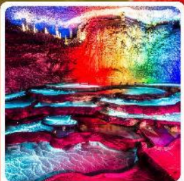
ถ้ำเก้าเทพ

ไฮไลท์! หมู่บ้านชาวน้ำเสียวเหอจินเจีย หมู่บ้านโบราณผู่หงเจิ้น ถ้ำเก้าเทพ ล่องเรือทะเลสาบผิงหู สวนถ้ำสามสหาย