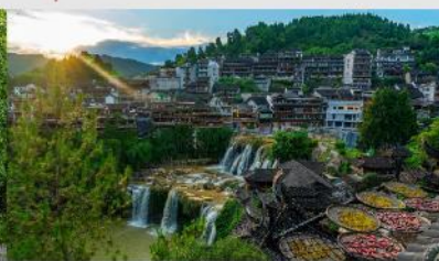
หมู่บ้านโบราณฝูหรงเจิน

*ทางบริษัทฯ ขอสงวนสิทธิ์ในการสลับโปรแกรมทัวร์ตามความเหมาะสมขึ้นอยู่กับสถานการณ์หน้างาน โดยคำนึงถึงผลประโยชน์ของลูกค้าเป็นสำคัญ