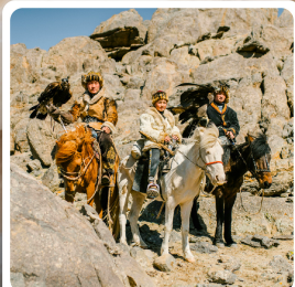
ชนเผ่ามองโก