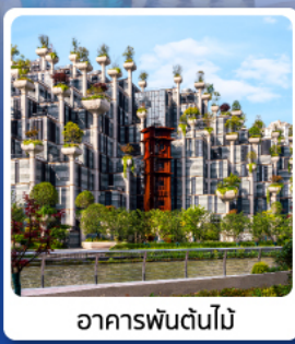
อาคารพันต้นไม้

ไฮไลท์...เที่ยวเซี่ยงไฮ้ หางโจว ซอปปิงถนนหนานกิง ชมความสวยงามของหาดไว่กาน ทะเลสาบซีหู