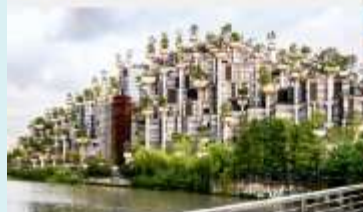
อาคารพินตันไผ่