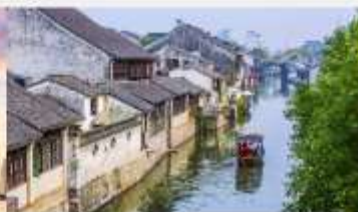
เมืองโบราณหนานซุน