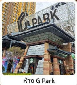
ห้าง G Park