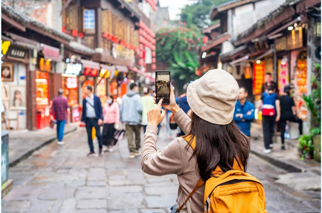
กลางวัน บริการอาหารกลางวัน ณ ภัตตาคารอาหารพื้นเมือง

จากนั้นนำท่านเดินทางสู่ หมู่บ้านโบราณฉือซีโซ่ว (Ciqikou Ancient Town) เป็นหมู่บ้านอนุรักษ์ ทางวัฒนธรรม และเป็นสถานที่ท่องเที่ยวชื่อดังของมหานครฉงชิ่ง ลักษณะก็คล้ายๆ กับตลาดเก่าหรือตลาดโบราณบ้านเรา สำหรับคนที่อยากไปย้อนเวลากลับไปในอดีตก็ต้องไปเยือน เพราะที่นี่ยังคงรักษาวิถีชีวิต รวมทั้งสะท้อนรากเหง้าดั้งเดิมของเมืองไว้ได้อย่างดีเยี่ยม ไม่ว่าจะเป็นตึกoramบ้านช่องที่มีรูปทรงโบราณ แหล่งผลิตสินค้า และอาหารพื้นเมืองที่สืบทอดกิจการต่อกันมาหลายรุ่น