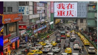
กวนอิมเจียว

*ทางบริษัทฯ ขอสงวนสิทธิ์ในการสลับโปรแกรมทัวร์ตามความเหมาะสมขึ้นอยู่กับสถานการณ์หน้างาน โดยคำนึงถึงผลประโยชน์ของลูกค้าเป็นสำคัญ