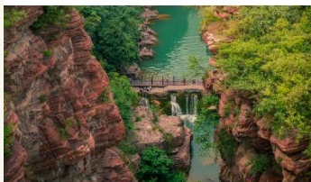
อุทยานสวรรค์หยุนโถซาน