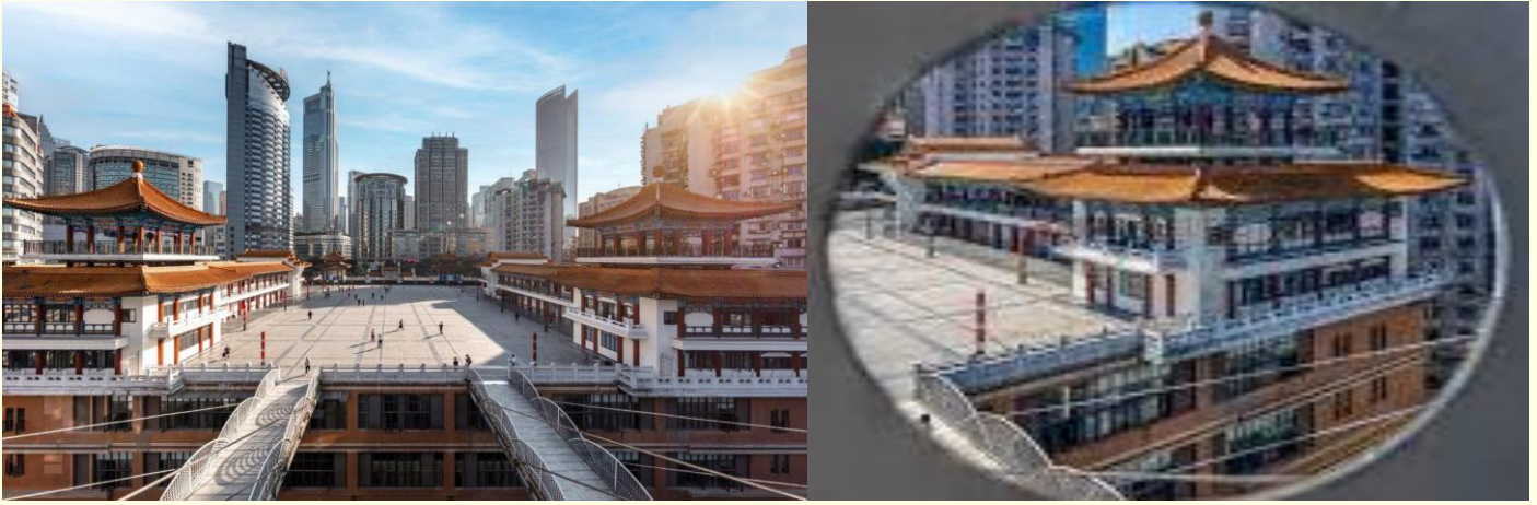
ตึก 22 ชั้น (Kuixing Building)

นำท่านสู่ ถนนโบราณหลงเหมินฮ่าว ย่านถนนหนานปิ่น เดิมเคยเป็นย่านเมืองเก่าของคน ชาวต่างชาติ ปัจจุบันเป็นถนนโบราณทางประวัติศาสตร์และวัฒนธรรมที่ได้รับการอนุรักษ์ไว้ และ ท่านสามารถมองเห็นสะพานข้ามแม่น้ำแยงซีเจียง คือสะพานตงสู่ยเหมิน เป็นสะพานสองชั้น ชั้น ล่างให้รถไฟฟ้าวิ่ง ด้านหลังเป็นเขาหนานซาน