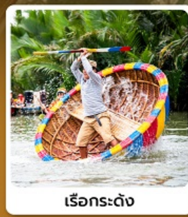
เรือกระดง