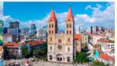
โบสถ์คริสต์เซนต์ไมเคิล

*ทางบริษัทฯ ขอสงวนสิทธิ์ในการสลับโปรแกรมทัวร์ตามความเหมาะสมขึ้นอยู่กับสถานการณ์หน้างาน โดยคำนึงถึงผลประโยชน์ของลูกค้าเป็นสำคัญ