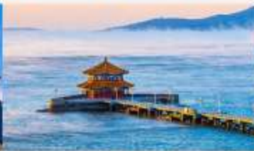
สะพานจันเจียว