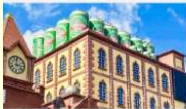
พิพิธภัณฑ์เบียร์ซิงเต่า