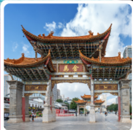
ประตูม้าทองไค่หยก