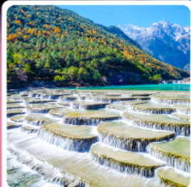
ทะเลสาบไป๋ส่วยเหอ