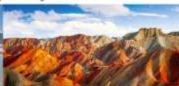
หุบเขาสายรุ้งจางเย่