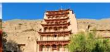
ถ้าแกะสลักม่อเกาคุ