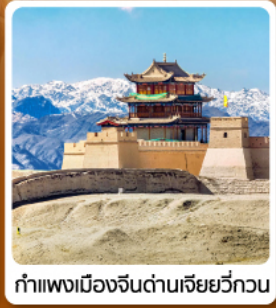
กำแพงเมืองจีนด่านเจียหยวี่กวน