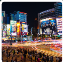
ตลาดกลางคืนซีเหมินติง