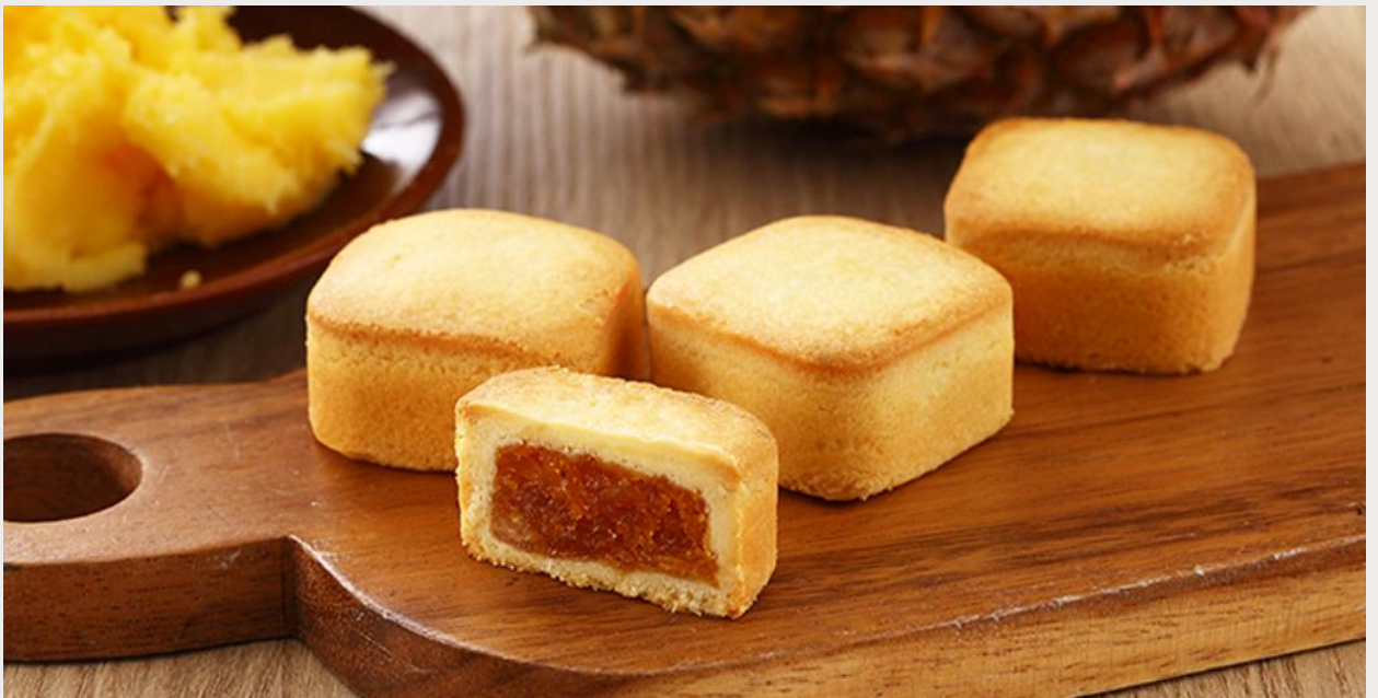
ร้านขนมพายสับปะรด (Taiwanese Pineapple Cake)

นำทุกท่านแวะชิม ร้านขนมพายสับปะรด (Taiwanese Pineapple Cake) ขนมที่ถือได้ว่ามีแหล่งกำเนิดมาจากเกาะไต้หวัน เนื้อแป้งหอมเนยห่อหุ้มแยมสับปะรด รสชาติมีความหวาน และความมันของเนยเล็กน้อย ผสมกับรสเปรี้ยวของสับปะรด ทำให้มีรสชาติที่กลมกล่อมจนเป็นที่นิยม ด้วยรสชาติที่เป็นเอกลักษณ์ไม่เหมือนใคร ทำให้ขนมพายสับปะรดเป็นขนมที่ขึ้นชื่อของเกาะไต้หวัน ไม่ว่าจะใครที่ได้มาเยือนก็ต้องซื้อเป็นของฝากติดมือกลับบ้าน นอกจากขนมพายสับปะรดแล้ว ยังมีขนมอีกมากมายให้เลือกชิม และเลือกซื้อ เช่น ขนมพระอาทิตย์ ขนมพายเผือก เป็นต้น อีสาระให้ทุกท่านเดินเลือกซื้อขนม