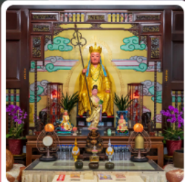
วัดพระถังซำจั๋ง