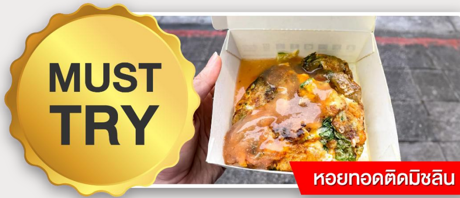
หอยทอดตัดมิชลิน

อิสระอาหารเย็นตามอัธยาศัย ณ ตลาดกลางคืนหนิงเซี่ย