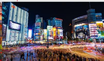
ตลาดกลางคืนซีเหมินต้ง

*ทางบริษัทฯ ขอสงวนสิทธิ์ในการสลับโปรแกรมทัวร์ตามความเหมาะสมขึ้นอยู่กับสถานการณ์หน้างาน โดยคำนึงถึงผลประโยชน์ของลูกค้าเป็นสำคัญ