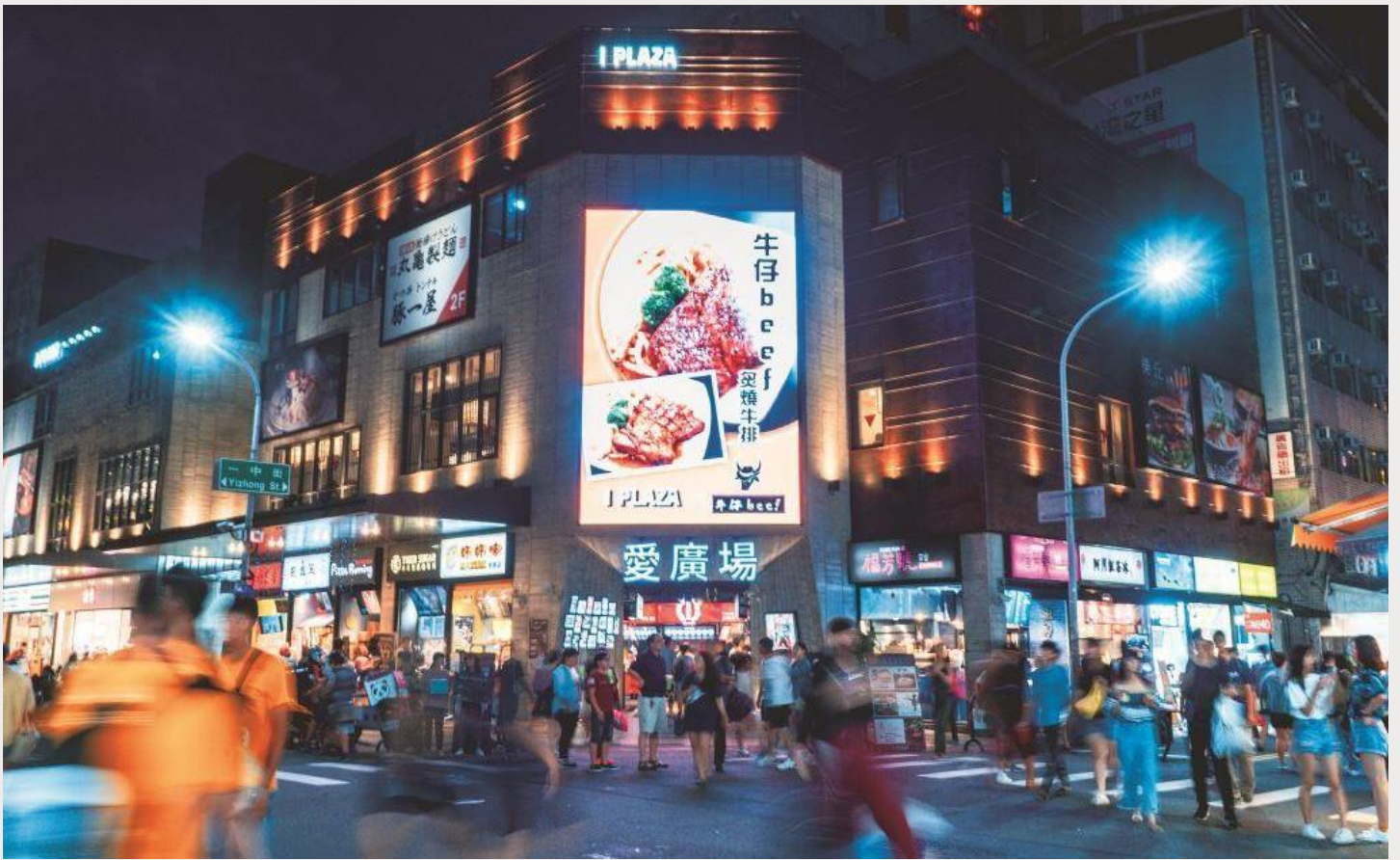
ตลาดกลางคืนอิง (Yizhong Street Night Market)