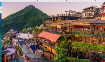
ถนนโบราณจิวเฟิ่น