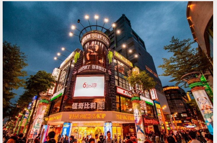
ตลาดกลางคืนซีเหมินติง (Ximending Night Market)

เย็น อิสระอาหารเย็นตามอัธยาศัย ณ ตลาดกลางคืนซีเหมินติง